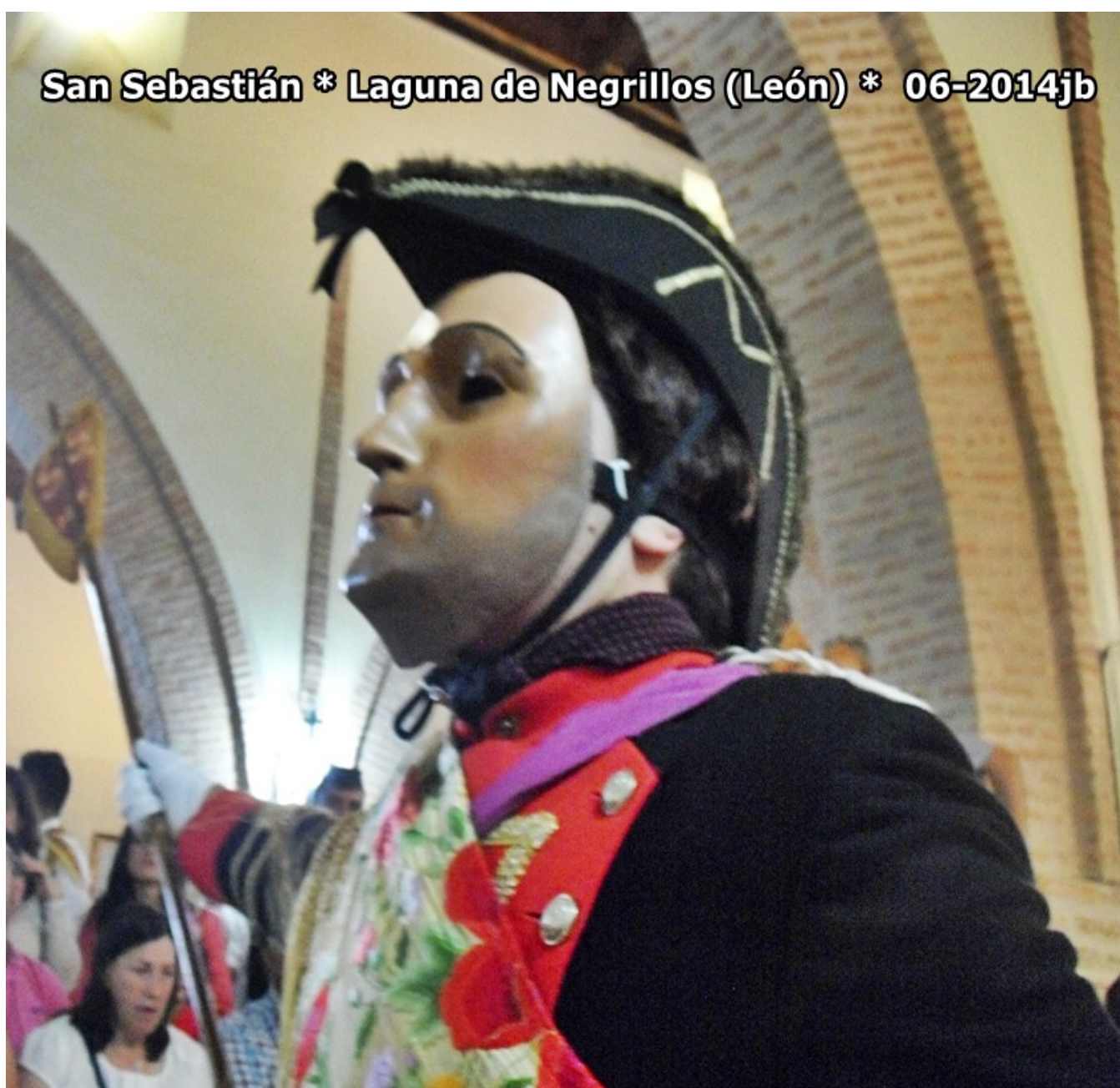
San Sebastián * Laguna de Negrillos (León) * 06-2014jb