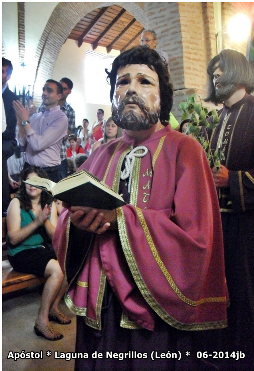
Apóstol * Laguna de Negrillos (León) * 06-2014jb