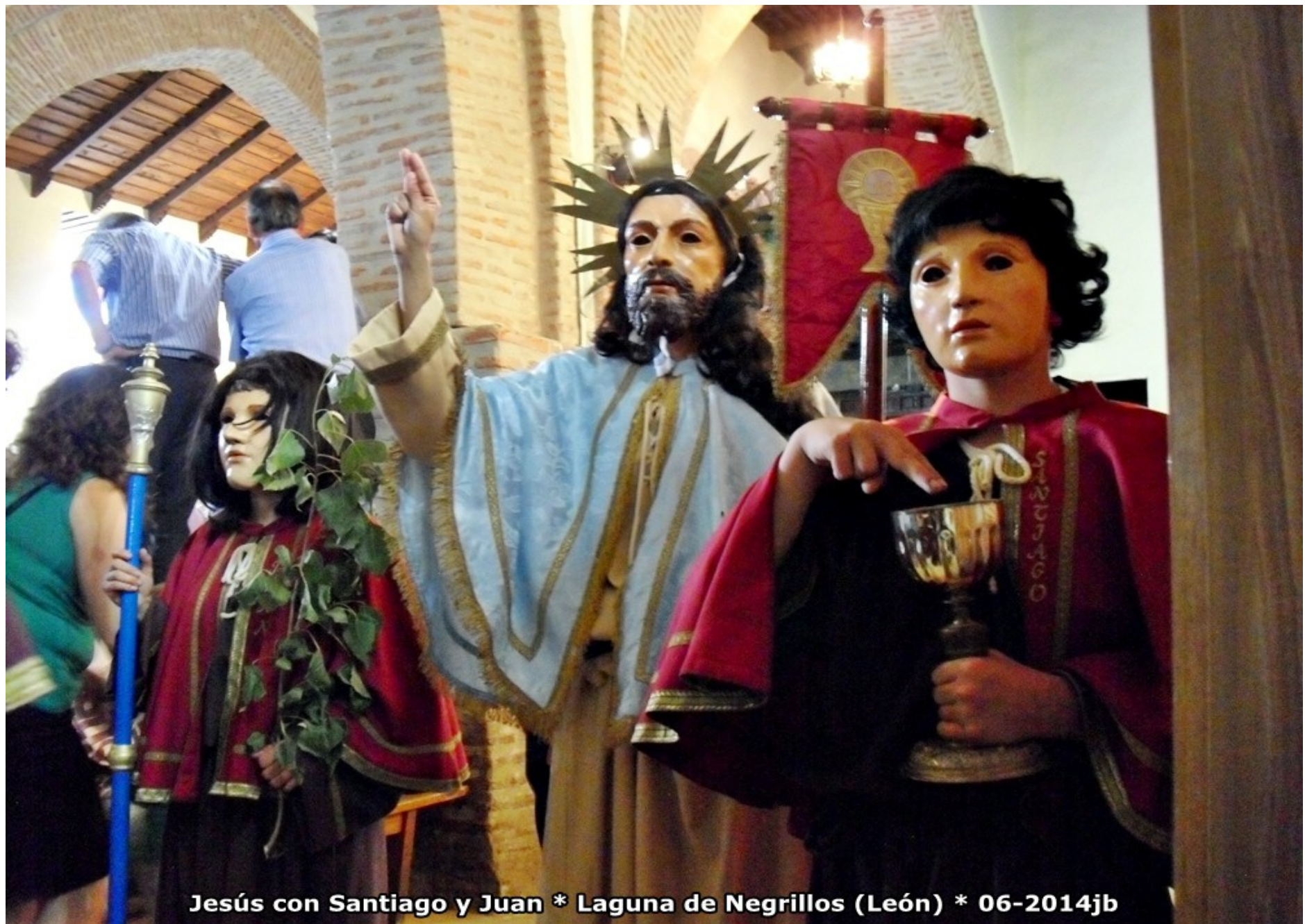
Jesús con Santiago y Juan * Laguna de Negrillos (León) * 06-2014jb