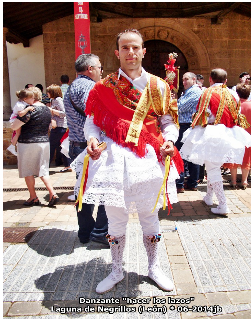
Danzante "hacer los lazos" Laguna de Negrillos (León) * 06-2014jb