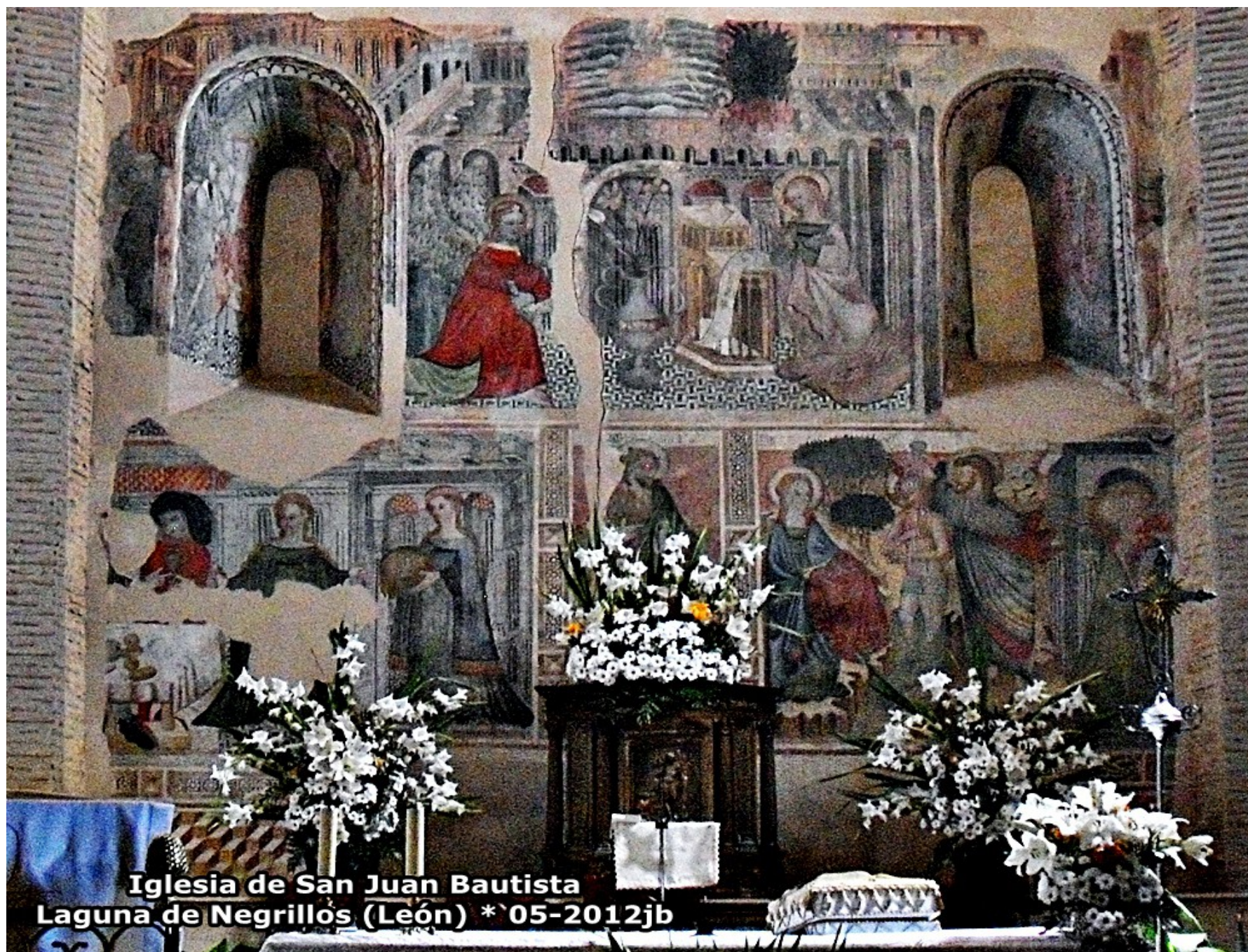
Iglesia de San Juan Bautista Laguna de Negrillos (León) * 05-2012jb