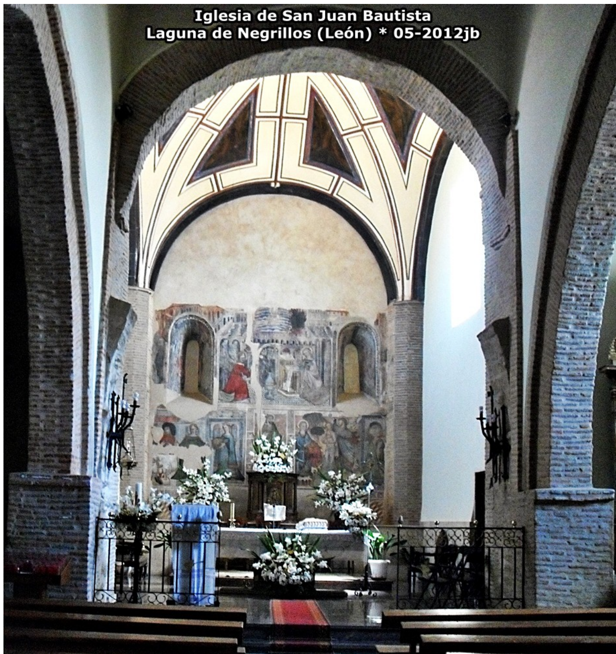
LAGUNA DE NEGRILLOS (León)