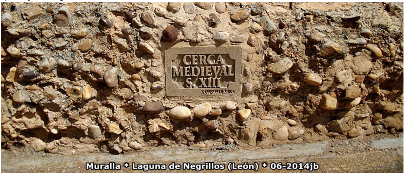
Muralla * Laguna de Negrillos (León) * 06-2014jb

El destino es sabio y me ha hecho pasar 2 días muy felices en este tranquilo pueblo a 778 m. de altitud y a donde espero volver, al cual le ofrezco -que menos- este breve reportaje en agradecimiento.