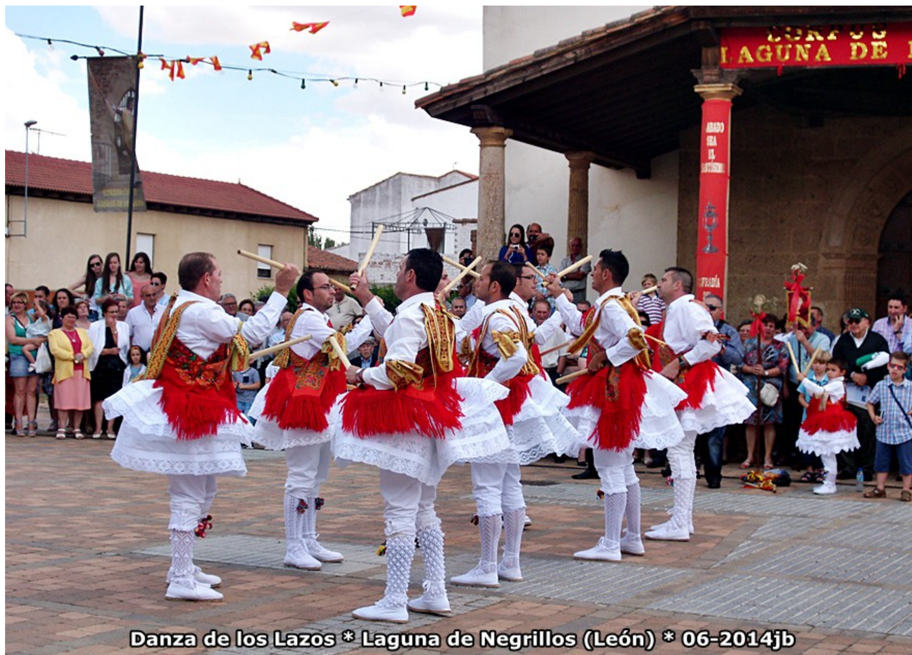
Danza de los Lazos * Laguna de Negrillos (León) * 06-2014jb