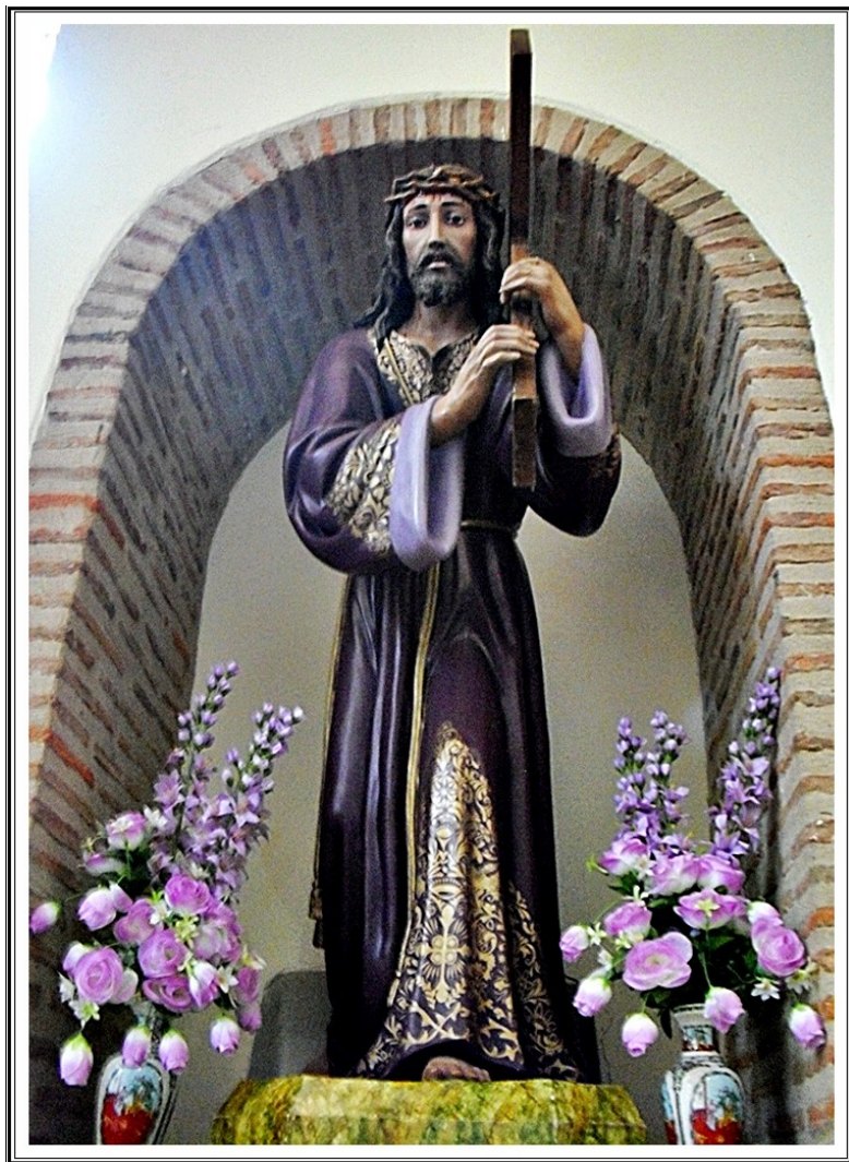
Nazareno Iglesia de San Juan Bautista Laguna de Negrillos (León) * 05-2012jb